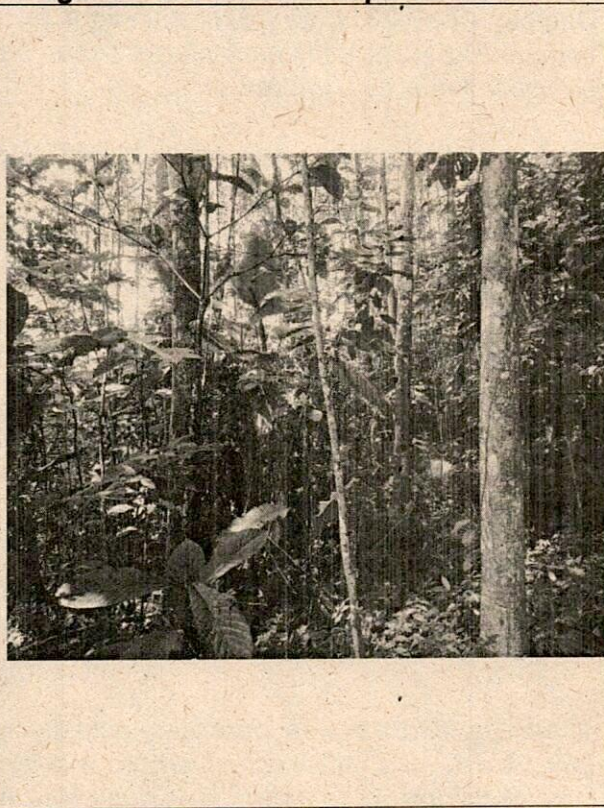
Imagen N° 4. panorámica parcela 4