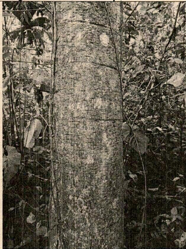
Imagen N° 3. Arbol de referencia parcela 4