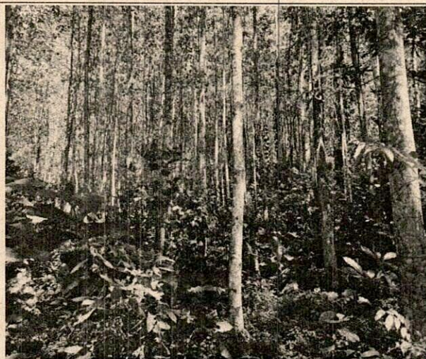
Imagen N° 1. Panorámica parcela 1