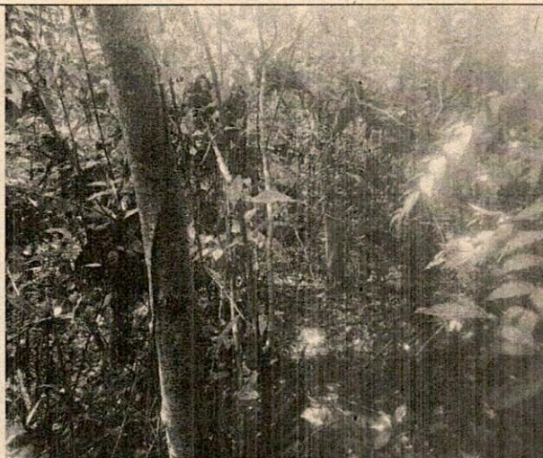
Imagen N° 2. Panorámica parcela 2