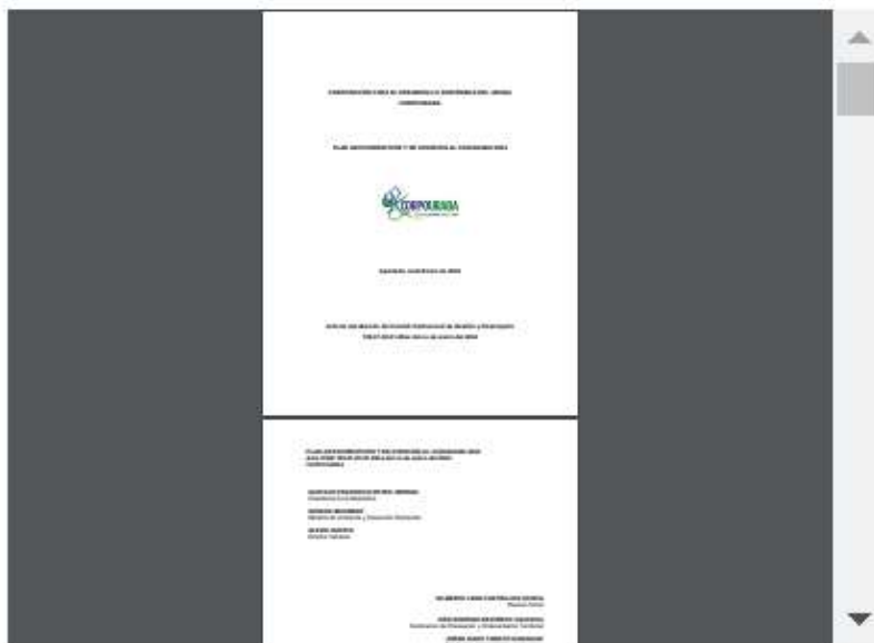
9. PLAN ANTICORRUPCIÓN Y ATENCIÓN AL CIUDADANO 2024