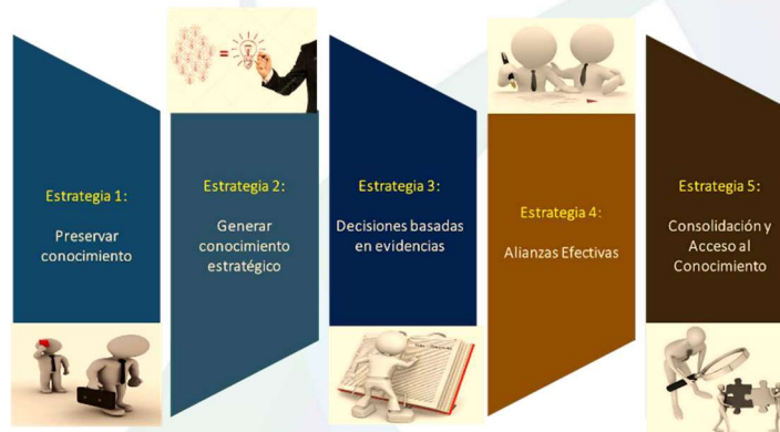
Gráfica 2: Estrategias Ruta de implementación propuesta por el DAFP Fuente: Departamento Administrativo de la Función Pública

El Departamento Administrativo de la Función Pública, recomienda a las entidades que para la definición y puesta en marcha de un plan de implementación considere, entre otras, las estrategias contenidas en particular para esta Política en la hoja de ruta indicada en la versión 3 del Manual Operativo del Modelo Integrado de Planeación y Gestión, así: