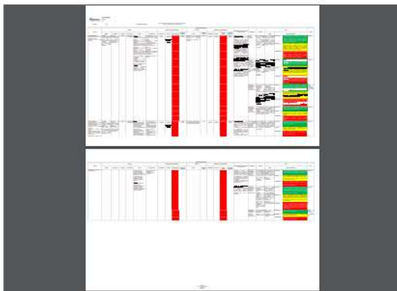
13. R-MU-10 MAPEO DE RIESGOS CORRUPCIÓN 2024