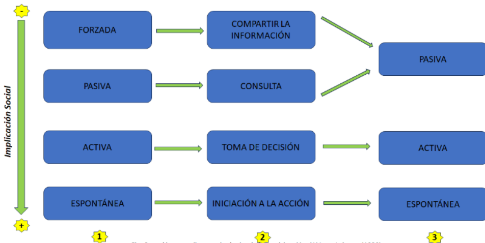
Fig. Conexión entre diversas tipologías de la participación. (1) Levy-Leboyer (1980) – Paul (1987) – Saegert (1987).

Desde luego, no es posible hablar de la "participación" como una entidad única definible (Gudynes y Evia. 1993), de manera que pueden señalarse diferentes tipologías de participación en base a sus diversos procedimientos, contenidos y objetivos, categorías que expresan de esta forma distintas bases éticas. Así, las clasificaciones existentes establecen diversos grados entre una participación superficial o restrictiva y una participación profunda o abierta: considerando un conjunto definido por estos otros polos donde pueden situarse diversas perspectivas de la participación (Fig. 1),