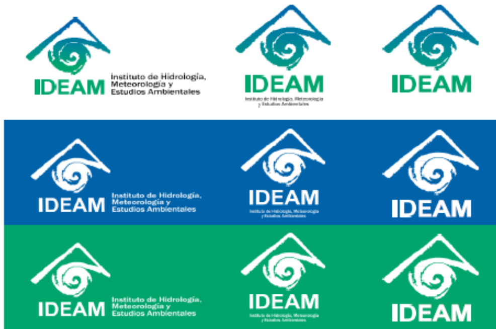
Imagen 5. Versiones de Color.