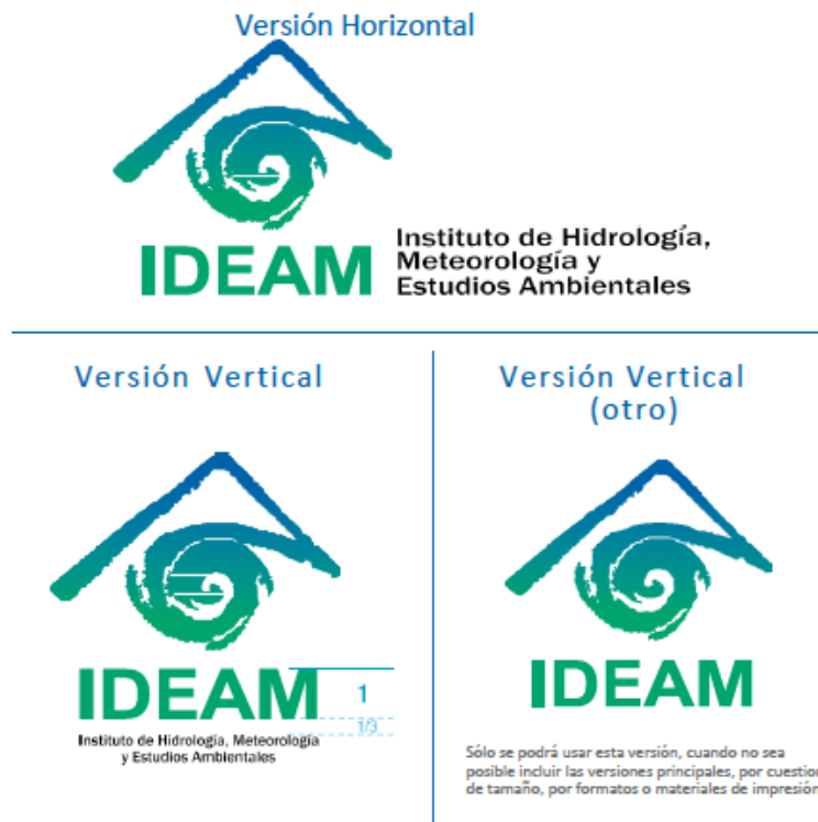
Imagen 1. Logotipo del IDEAM