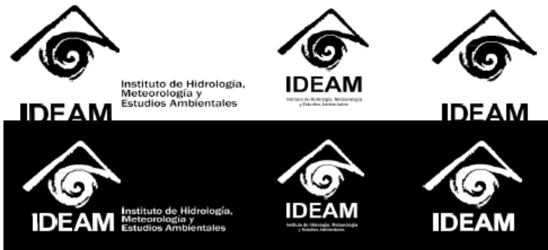
Imagen 6. Versiones Monocromáticas.