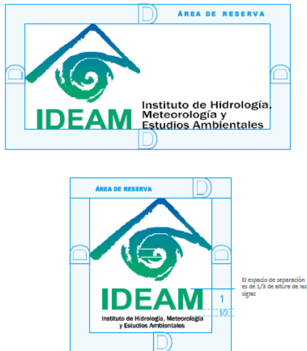
Imagen 2. Área de Reserva