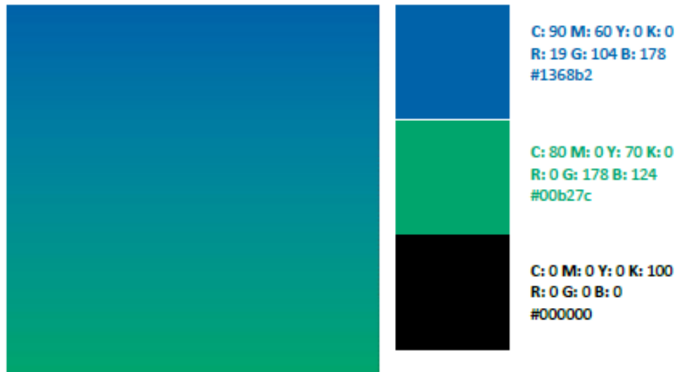
Imagen 4. Colores.

Fuente: Manual de Identidad Visual, E-GC-M002, versión 3, página 13