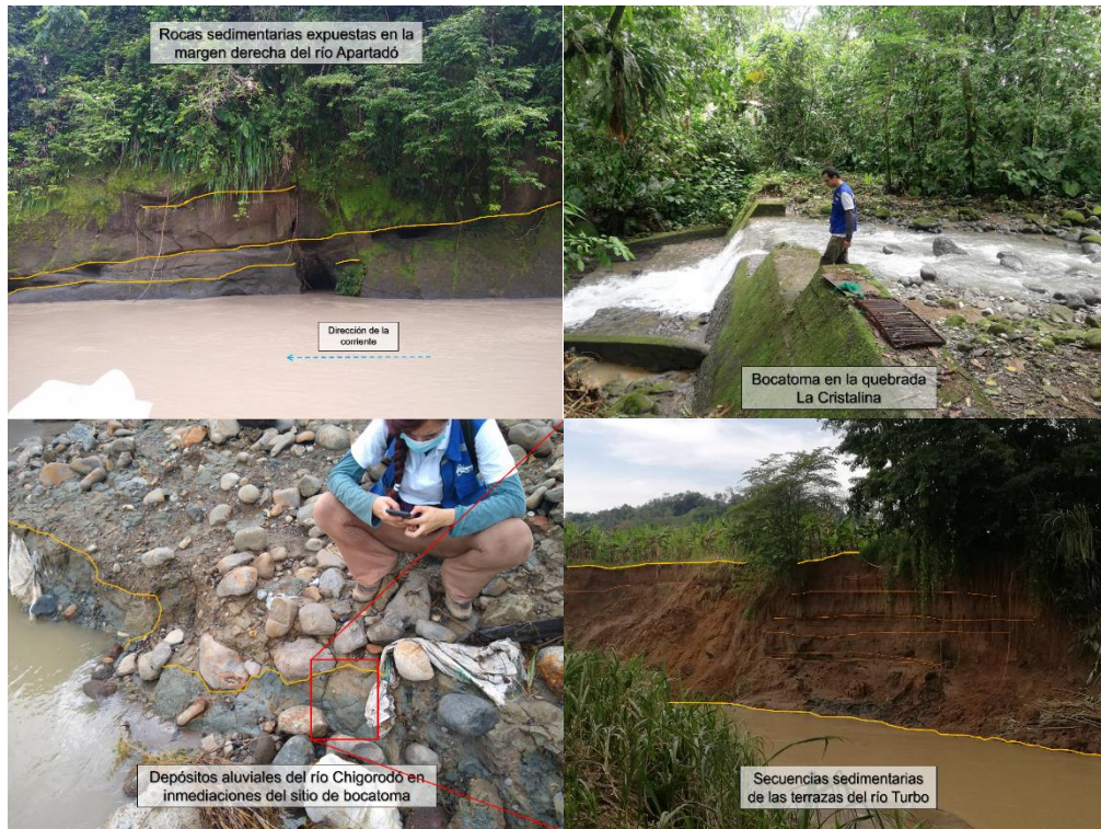
Actividades de campo en el proceso de diagnóstico del riesgo por desabastecimiento