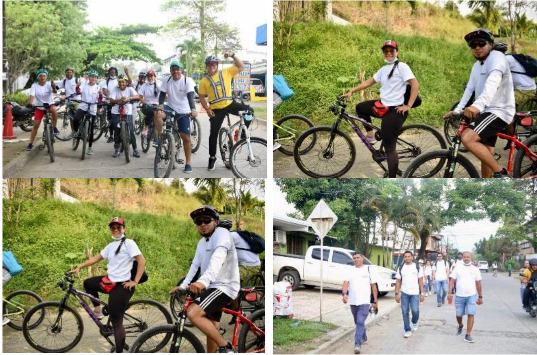
Jornada de bienestar laboral pre pensionados.