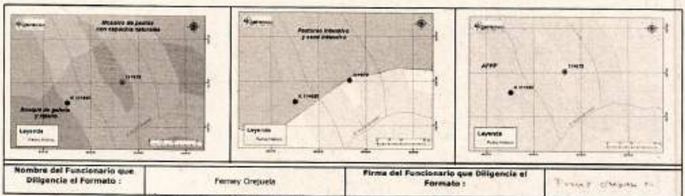
Ilustración 15. Resultado de análisis cartográfico.