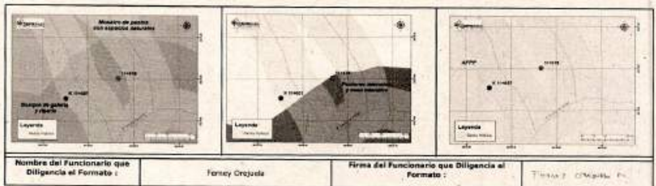
Ilustración 15. Resultado de análisis cartográfico.