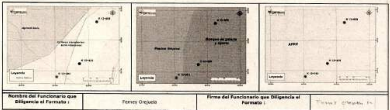
Ilustración 15. Resultado de análisis cartográfico.