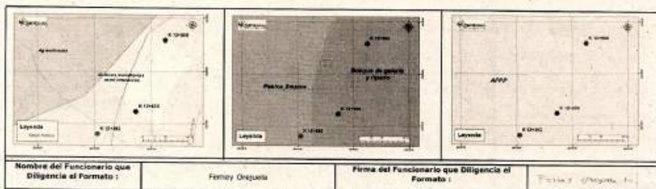
Ilustración 26. Resultado de análisis cartográfico.