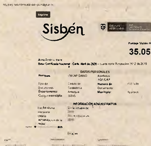
Imagen 1. Reporte del SISBEN https://www.sisben.gov.co/atencion-al-ciudadano/paginas/consulta-del-puntaje.aspx

Oscar Darío Aguilar, identificado con cédula de ciudadanía No. 8.337.649, puntaje del Sisbén 35.05 que equivale al nivel 3 del SISBEN, lo cual le da una capacidad socioeconómica de 0,03. Se adjunta reporte de la entidad.