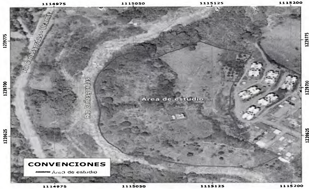
Área de aprovechamiento –predio La Esperanza lote 8.

Por la cual se otorga un aprovechamiento forestal único y se adoptan otras disposiciones.