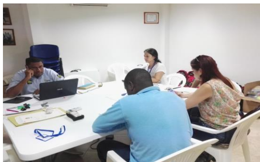
Figura 11. Espacio de participación en Corporación Rosalba Zapata.

El tercer espacio se realizó el 10 de enero de 2017 en el municipio de Apartadó. Se trató la conformación del consejo de cuenca con el Secretario de Agricultura y Medio Ambiente del Municipio de Apartadó y con miembros de la Corporación Rosalba Zapata (ONG) (ver Figura 11). Ambas reuniones fueron privadas y concretas, ya que ambos actores ya contaban con los documentos para la postulación y conocían el proyecto. Por ende, la reunión fue un espacio para explicar la metodología de la elección así como recordar la fecha y el sitio de votación (ver Anexo 7).