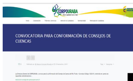
Figura 4. Convocatoria para conformación de Consejos de Cuencas en página web de CORPOURABA

En atención a lo establecido en la Resolución 509 de 2013 (Ministerio de Ambiente y Desarrollo Sostenible, 2013, págs. 3, artículo tercero, numeral 2), se publicó el 23 de noviembre de 2016 la convocatoria para conformación de consejos de cuencas, en la página web de CORPOURABA (ver Figura 4). Igualmente, el 28 de diciembre de 2016 se publicó la circular N° 400-05-01-02-0064-2016 mediante el cual se extendió el plazo para la recepción y entrega de documentos (ver Figura 5 y Figura 4).