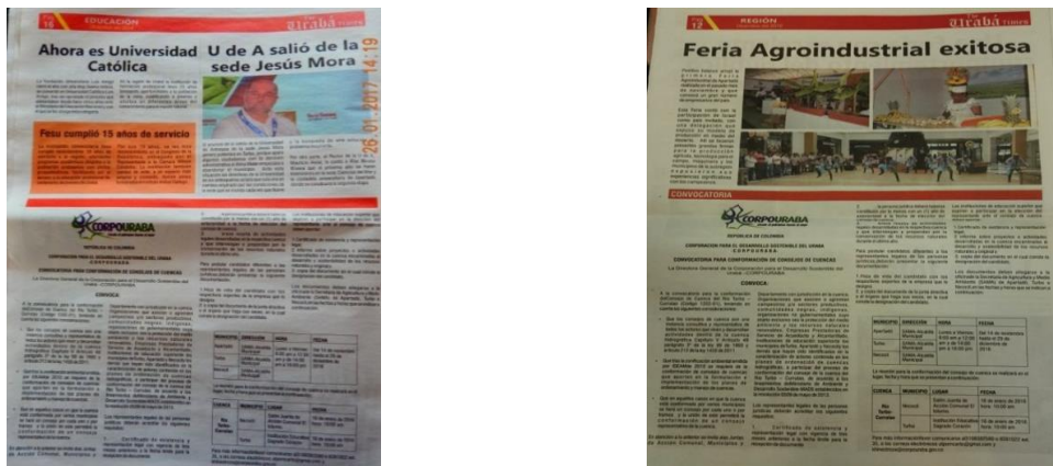
Figura 7. Publicación de la convocatoria en Urabá Times.