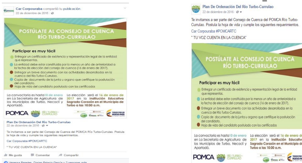
Figura 9. Volante Informativo Consejo de Cuenca

Se diseñó una pieza gráfica con conceptos claves sobre el Consejo de Cuenca publicado en la red social de CORPOURABA del POMCA Río Turbo-Currulao; esta pieza gráfica corresponde a un volante informativo con la definición del Consejo de Cuenca, funciones de un consejero, requisitos para la postulación, fecha límite para la recepción de documentos y fecha de elección. La pieza informativa fue enviada el 28 de diciembre de 2016 a los correos electrónicos registrados en la base de datos de los actores del POMCA Río Turbo-Currulao; además, fue publicado en el Facebook oficial de CORPOURABA y del POMCA a partir del 22 de diciembre de 2016 (ver Figura 9).