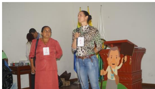
Figura 15. Presentación de postulados al Consejo de Cuenca.

En un segundo momento, se realizó la votación; en ella los representantes de cada grupo de actor se presentaron ante los asistentes y realizaron de manera verbal una pequeña reseña de las actividades que desarrollan en la cuenca. A cada una de estas personas, se le entregó una escarapela con un número para facilitar el proceso de votación (ver Figura 15).