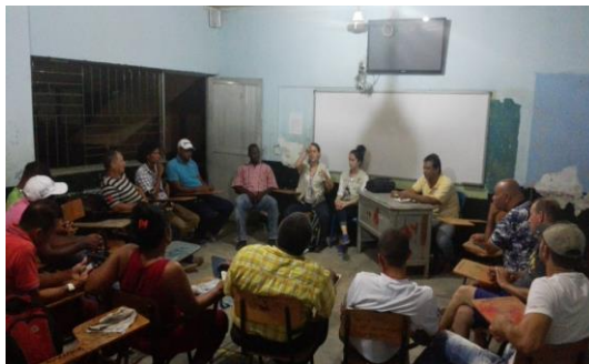
Figura 14. Espacio de participación en Currulao, 13 de enero de 2017.

A continuación, se presenta el número de actores convocados y los medios de comunicación usados para difundir la información y motivar a cada uno postularse y conformar el consejo de cuenca del POMCA río Turbo-Currulao: