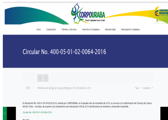
Figura 5. Circular No. 400-05-01-02-0064-2016 en página web de CORPOURABA. Tomado de http://corpouraba.gov.co/2016/12/29/circular-no-400-05-01-02-0064-2016/ 28 de diciembre de 2016.

Adicionalmente, tanto la resolución como circular fueron publicados en los murales externos de las Alcaldías de Apartadó, Turbo y Necoclí (ver Figura 6). La publicación en las tres entidades municipales, se realizó desde el 30 de noviembre de 2016 hasta el 12 de enero de 2017.