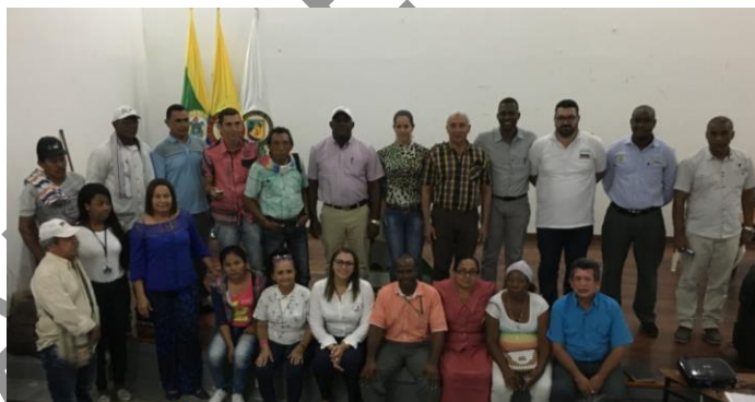
Figura 17. Consejo de Cuenca POMCA Río Turbo-Currulao.