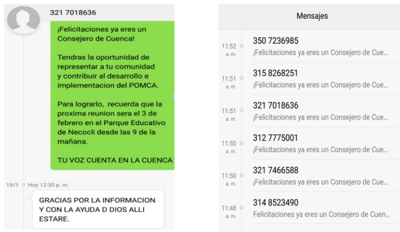
Figura 18. Mensajes de texto enviados a consejeros

enviada mediante correos electrónicos y mensajes de texto (ver Figura 18 y Anexo 20)