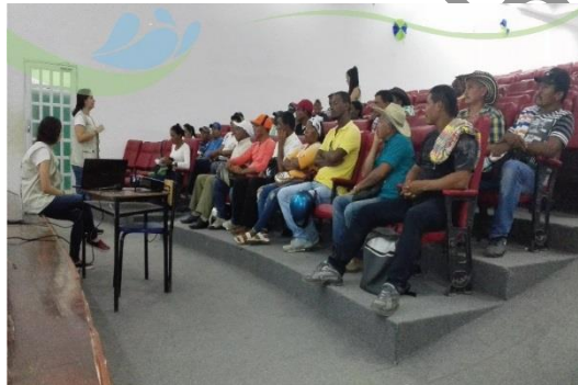
Figura 10. Espacio de participación en Turbo.

Figura 10). En la reunión estuvieron presentes 32 personas, a quienes se convocó a la reunión 15 días de antes por medio de llamadas telefónicas y mensajes de texto (ver Anexo 5)