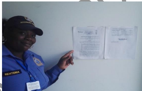
Figura 6. Publicación de Resolución en Alcaldía de Turbo.

Adicionalmente, tanto la resolución como circular fueron publicados en los murales externos de las Alcaldías de Apartadó, Turbo y Necoclí (ver Figura 6). La publicación en las tres entidades municipales, se realizó desde el 30 de noviembre de 2016 hasta el 12 de enero de 2017.