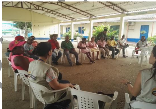
Figura 13. Espacio de Participación en El Totumo.

Este espacio se efectuó el 13 de enero de 2017 en el Municipio de Necoclí, Corregimiento El Totumo (ver Anexo 9) En la reunión estuvieron presentes líderes comunitarios, Asociaciones de Campesinos y de Sectores productivos, la Defensa Civil, La Policía Ambiental y la Junta de Acción Comunal del corregimiento; se dio información sobre el proceso de convocatoria, conformación y elección del Consejo de Cuenca (ver Figura 13).