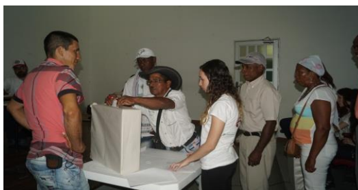
Figura 16. Proceso de votación por cada grupo de actor

De esta manera, se realizó la votación por cada grupo de actor (ver Figura 16) obteniendo los siguientes resultados: