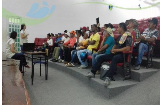
Figura 10). En la reunión estuvieron presentes 32 personas, a quienes se convocó a la reunión 15 días de antes por medio de llamadas telefónicas y mensajes de texto (ver Anexo 5)

Educativa Sagrado Corazón de Turbo con las Juntas de Acción Comunal, asociaciones de sectores productivos y campesinos y prestadores de servicios de acueducto y alcantarillado (ver