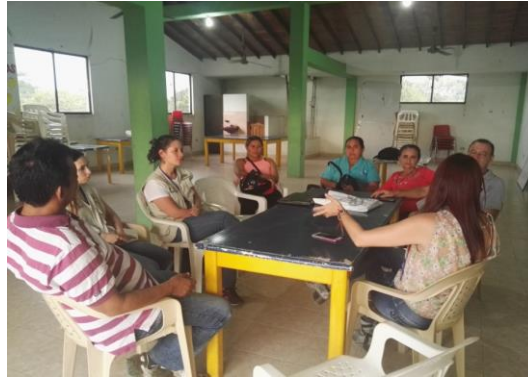
Figura 12. Espacio de participación en Currulao, 12 de enero de 2017