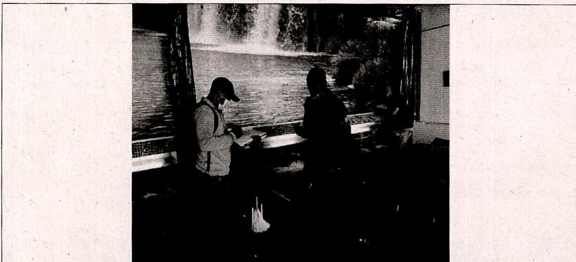
Figura 3: explicación de los delitos por tenencia de fauna silvestre en cautiverio

Por el cual se declara iniciada investigación sancionatoria ambiental y se adoptan otras disposiciones.