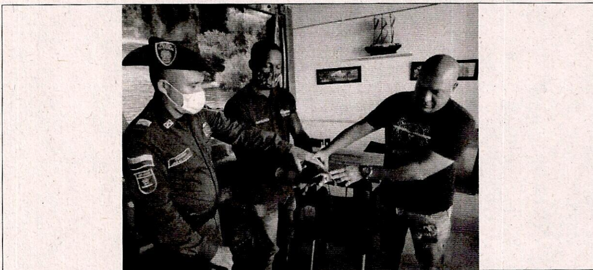
Figura 4: recuperación del ejemplar de fauna silvestre