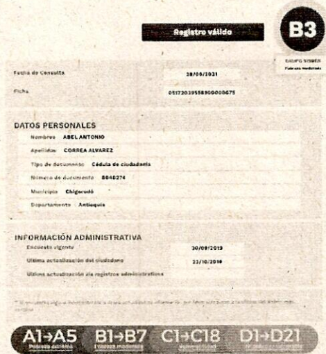
Ilustración 1: Tomado el 28/04/2021

Abel correa , identificado con C.C. No 8.046.274 , se encuentra dentro de la categoría B3 , de acuerdo a la base de datos del SISBEN- Pobreza moderada