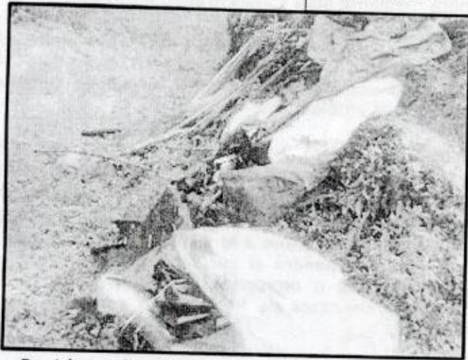
Residuos de plásticos a orillas de carretera